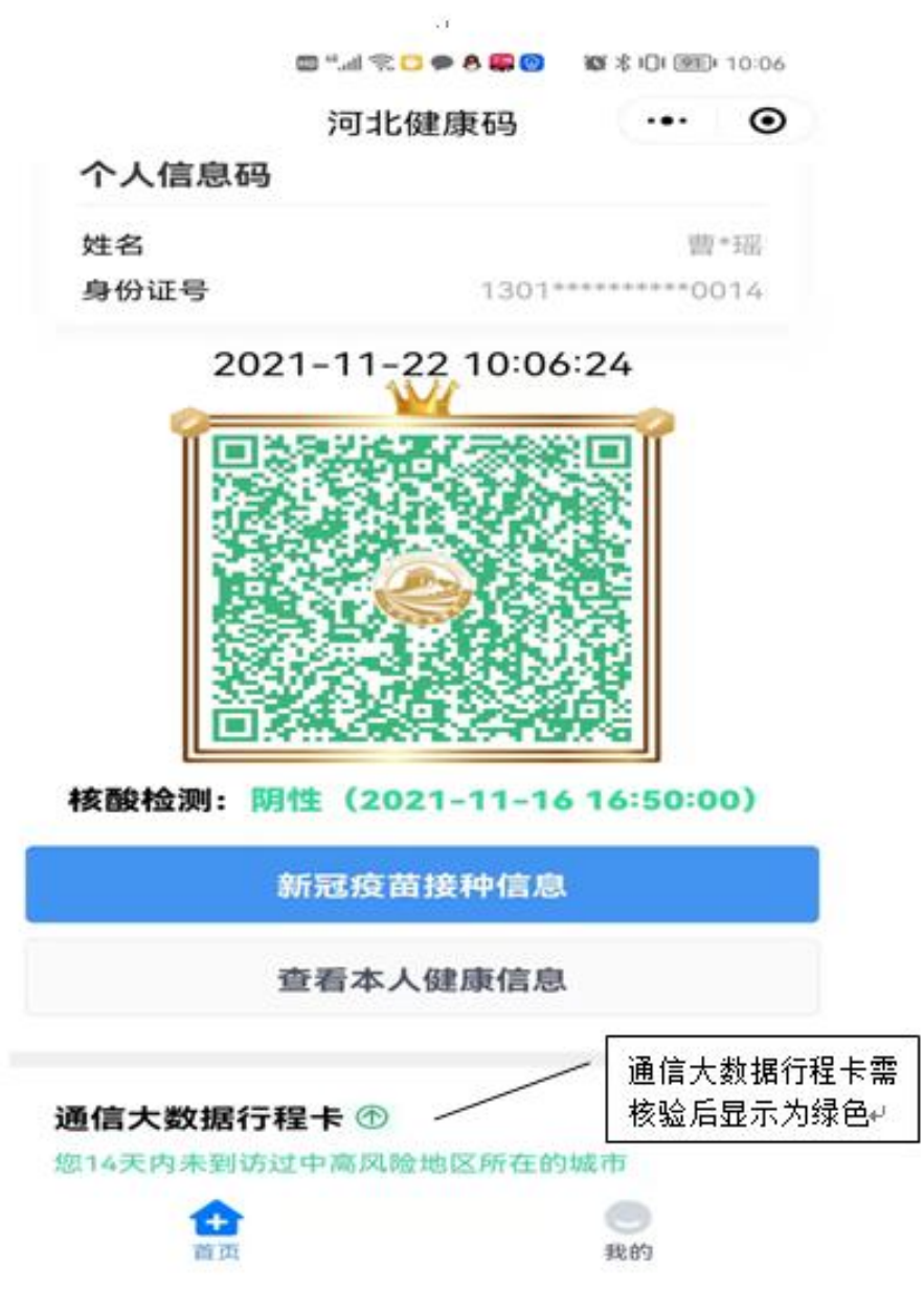
图片 1- “河北健康码”（含“通信大数据行程卡”）（须显示绿色）

提醒考生：1. 以下 2 个图片均须考前打印；2. 图片 2 要求显示考前连续 14 日体温，任何一天不允许出现“未打卡”情况。